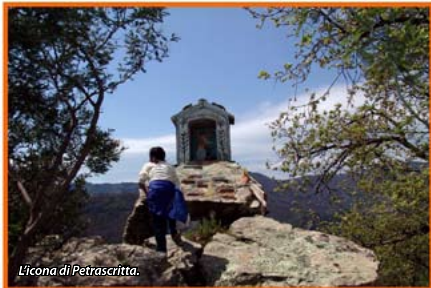
L'icona di Petrascritta.

porta al punto di confluenza dei fiumi Mérito e Corace, vera meraviglia geologica in cui i due fiumi, invece di 'confluire' uno nell'altro, si 'scontrano' uno contro l'altro. Questo luogo è il risultato di enormi sconvolgimenti tellurici avvenuti in epoche recenti dal punto di vista geologico, ma lontanissime dal punto di vista storico. Infatti, la gola nella quale si riversano i due fiumi dopo il loro "scontro", è nata da una frattura del monte a destra che si è ribaltato e saldato sul monte a sinistra, probabilmente realizzando anche un lago naturale fin quando l'acqua non ha trovato una nuova strada, riducendo il fronte della frana e svuotando il la-