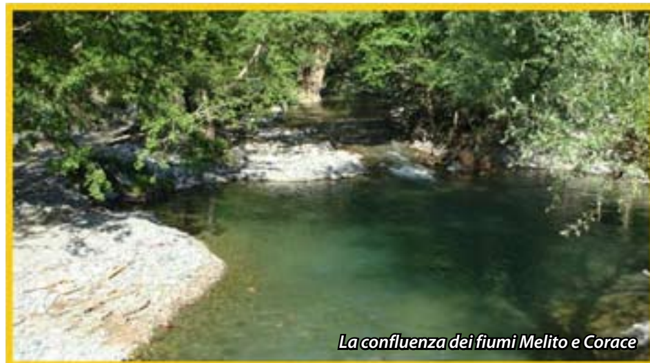
La confluenza dei fiumi Melito e Corace

Il percorso previsto partirà da Contrada Croci (a ridosso del cimitero di Gimigliano) per raggiungere la zona denominata "Petrascritta" attraverso un affascinante tratto di 'via pubblica' del '700. Qui, narra la leggenda, è presente un grosso masso sul quale, secondo fonti orali, pare esistesse una incisione di qualche buontempone, che riportava la frase: beatu cu mi vota. Si dice che dopo qualche tempo qualche curioso riuscì a girare la grossa pietra scoprendo soltanto una nuova frase: e mo' chi m'ha votatu staju bonu 'e statrhu latu. Sempre nello stesso luogo nel 1861 'sembra' sia stato ucciso dalle milizie del tempo il brigante di Miglierina Giuseppe Guzzo detto Fhaciune (faccione), al quale sarebbe stata mozzata la testa. E' da rilevare che la zona, oltre ad essere luogo di rifugio per molti briganti locali, era attraversata anche dall'unica pista percorribile da Catanzaro a Cosenza per arrivare a Napoli; per questo motivo rappresentava un luogo ideale per assaltare le corriere o i convogli su cui viaggiavano nobili, possidenti e militari. Il brigantaggio, come noi lo conosciamo, ebbe inizio storicamente dopo la partenza per l'esilio del re Francesco II di Borbone, avvenuta il 13 febbraio 1861; già due giorni