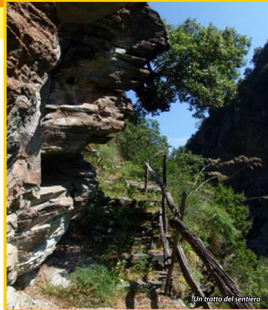
Un tratto del sentiero

Dal sentiero si potranno osservare anche i resti di antiche miniere del famoso marmo verde di Gimigliano (Serpentina) utilizzato nella gradinata della Chiesa del Gesù di Napoli, nei pavimenti della Reggia di Caserta, nelle nicchie della Basilica di San Giovanni in Laterano, nel piazzale centrale di San Pietroburgo, nella Venaria Reale di Torino ed in tantissime chiese e fabbricati di Catanzaro e del circondario. Il percorso termina con la visita alla vasca di troppo pieno della condotta idrica e, ritornati per la stessa via alle auto, ci ritroveremo all'agriturismo di Villa Simonella che ha la