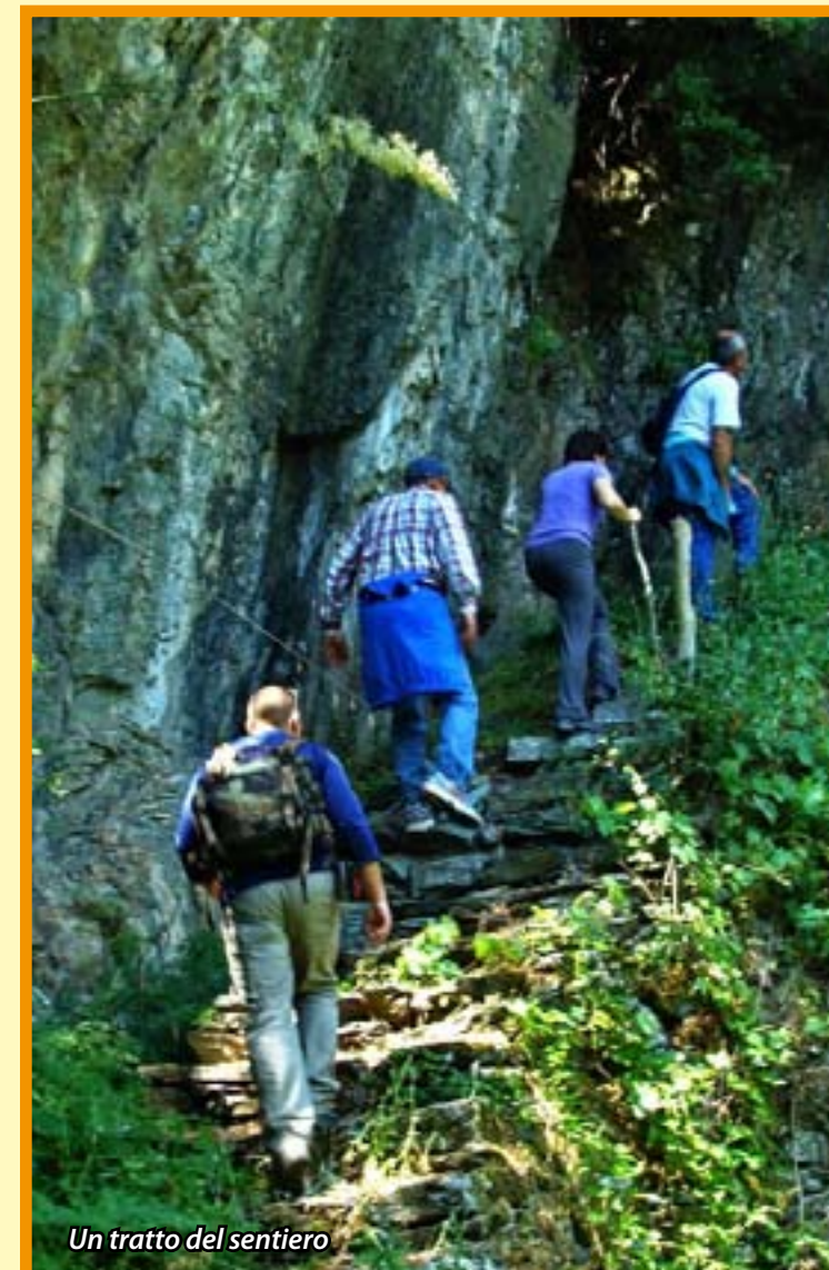
Un tratto del sentiero

Cosa occorre: indossare preferibilmente una tuta da ginnastica; zainetto; felpa; k-way; borraccia piena (durante il percorso non c'è possibilità di rifornimento d'acqua). E' obbligatorio indossare scarpe da trekking (o scarponcini).